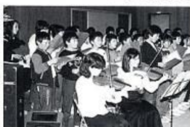
県民コンサート 松本交響楽団が生坂村にやってきました。村合併30周年の記念事業の一つとして昭和62年11月1日に小学校体育館で行われました。