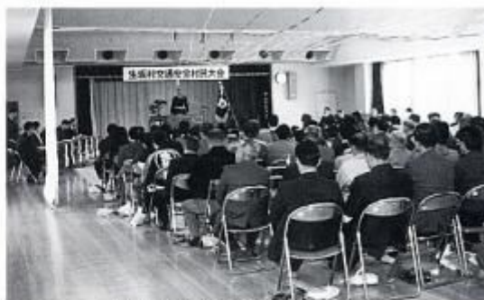
交通安全村民大会（平成元年11月）