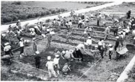
まず、畑の土づくりから