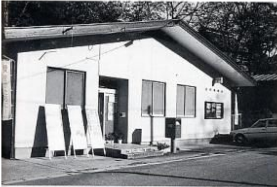
昭和45年新築の広津局 集配区一東広津・八坂 52年 13人、61年より8人