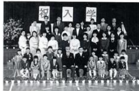
平成元年度入学式