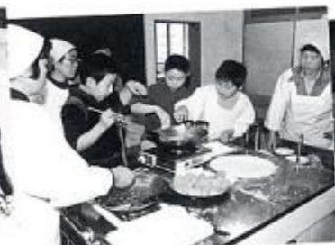
親子料理教室 学校が休みの日、親子で力を合わせて料理を作って食べました。お味はいかがでしたか？