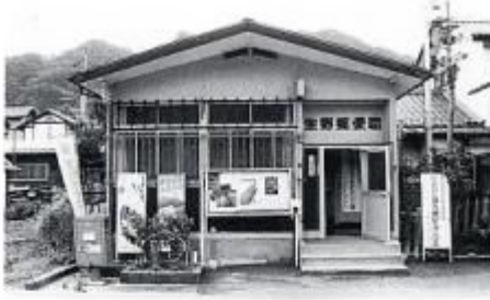
昭和41年新築の生野局 3人、49年より2人