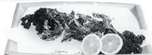
やまなみのアカワオのから揚げ