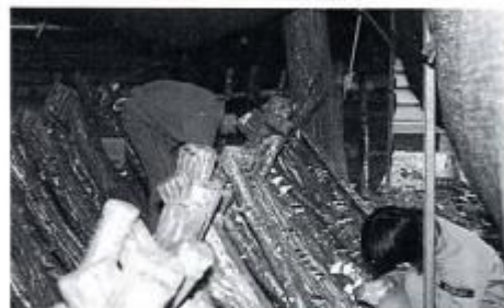
郷土産物を生かしたいだけ栽培