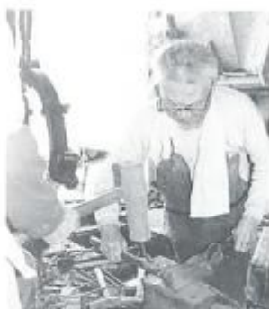
古坂のかじや 近 村の村々でただ1 人技術を守る。