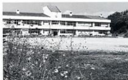
それから10年、落ち着きが出たたずまい