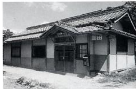
昭和11年新築の生野局