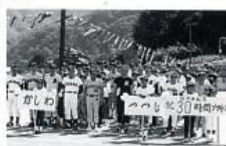
昭和62年8月8～9日 全国初の長時間野球が生坂村で行われてから4年目、村内対抗の30時間ソフトボールが行われました。対戦結果は151回戦、つじ282点对かしかわ229点でした。