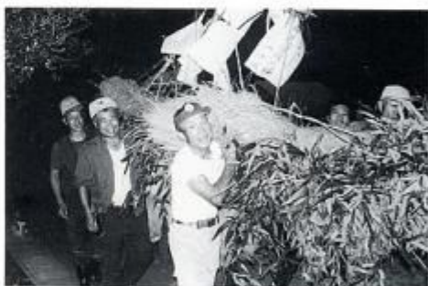
雲根の産の神送り