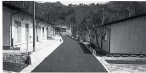
日岐の村営住宅(昭和58年写す)