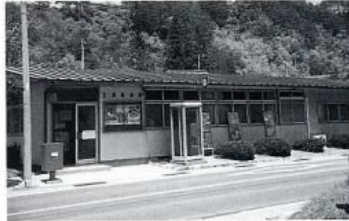
昭和37年新築の生坂局 (職員18人)