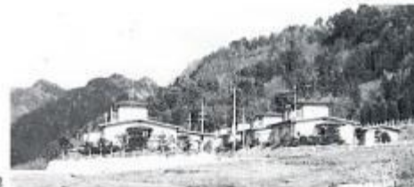
下生野の古坂集団移住団地