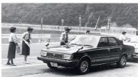
秋の婦人部の活動（昭和57年）