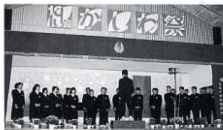
ひとりひとりの力を結集した「かしの祭」