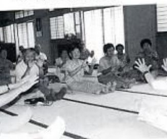
高齢者健康体操 自分の体は痛い所や曲がらない所ばかり。でも生きていることを感じさせてくれます。