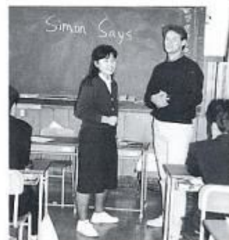
外人教師を招いて英語学習