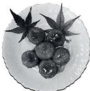
平成元年11月 県 の 牛乳乳製品コンクール1位のおからもち（生坂食飲作）