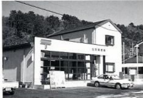
昭和63年新築の生坂局 (61年より10人)