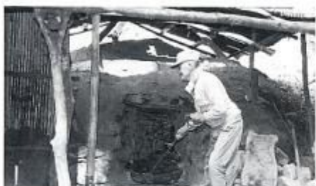
小立野入の炭やき 50人以上もいたのに1人になってしまう。