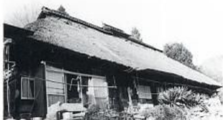
10軒程になった妻木屋根の家