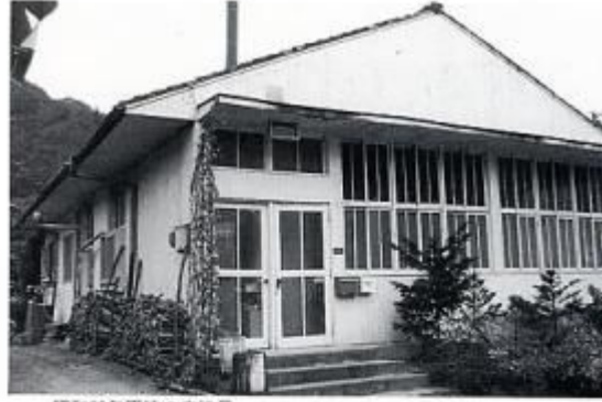
昭和23年再建の広津局