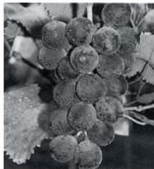
草尾と上生坂の巨峰