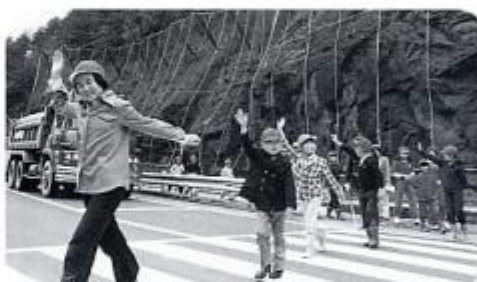
小学校の交通安全教室（昭和50年代）