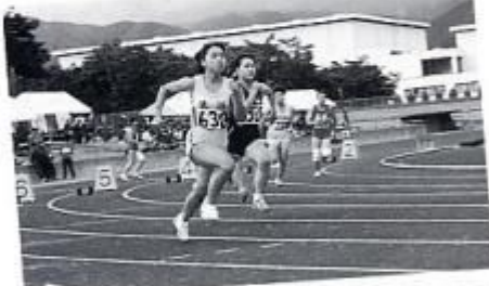
塩筑陸上競技大会での力走