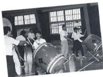
郷土学習の一環「龍翔太鼓」の実習