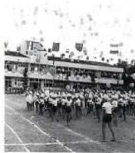
顔を込めて記念大運動会