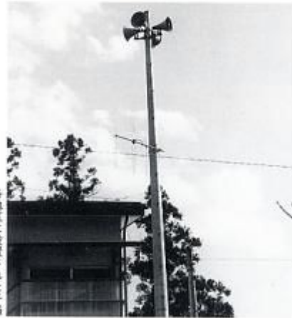
各地区に設置された子局

役場の総務課では、昭和62年4月より非常災害や行政のお知らせなどを放送しています。