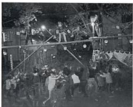
草尾の道祖神祭り