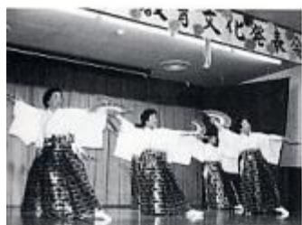
教育文化祭 毎年11月の文化の日のころ、文化祭が行われます。踊りや歌などの芸能の他に、手芸などの展示発表も行われます。