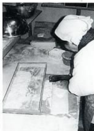
大日向のおひかけ（うどん）作り