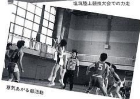
意気あがる部活動