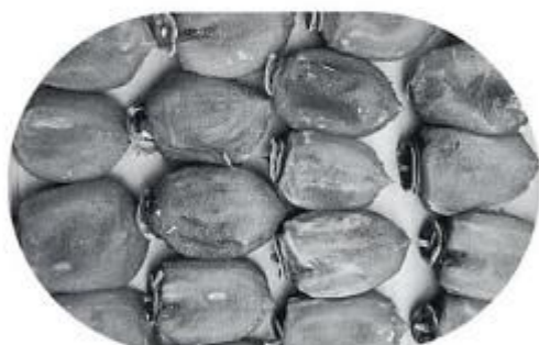
生坂の干柿 川霧のかかる柿は美味