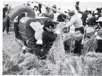
平ごたえのある重い稲穂