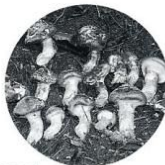
上生坂 しんせ 新生のまつたけ