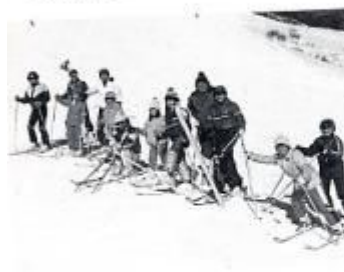
スキー教室 ふるさとの自然に親しもうと年2回、サンアルピナ血島積スキー場での親子スキー教室です。