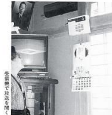
受信機で放送を聞く