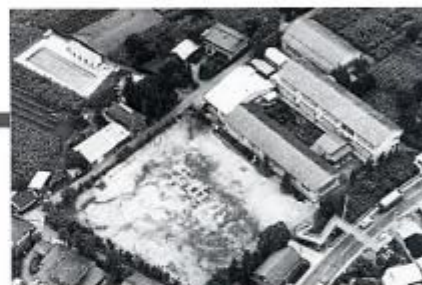
思い出の中央小学校