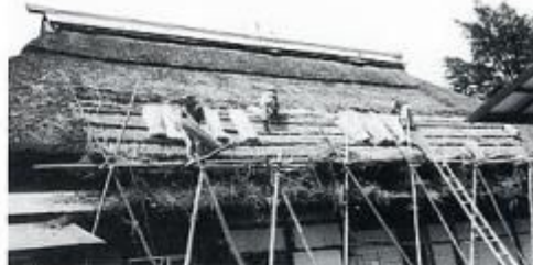
ゆい（相互手伝い）で行う「屋根がえ」