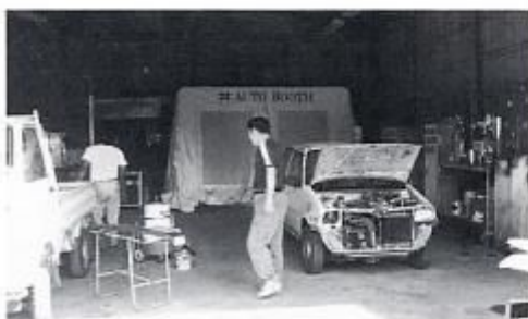
東信自動車で事故車の修理