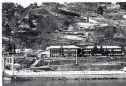
思い出の南小学校

昭和32年の町村合併により生坂村の小学校は、北、中央、南の3校となりました。ところが時代のさう勢から、年々各校の児童数が減少するようになり、そこで、21世紀を目指したくましく生き抜く子供の成長を願って、昭和54年、全村民の大変な決意と努力により、現在の生坂小学校が誕生しました。