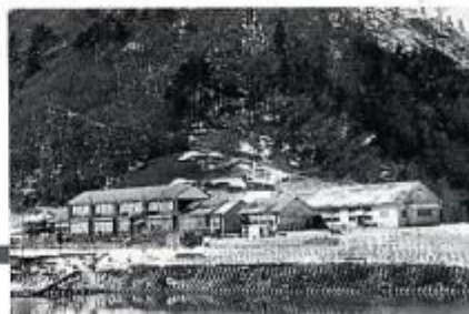
思い出の北小学校