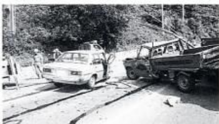
乗用車とトラックとの衝突事故